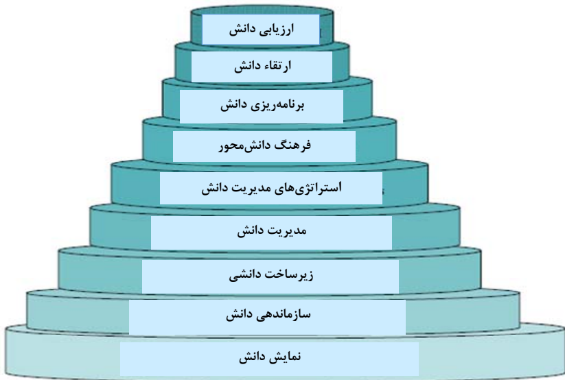
شکل ۲. مدل نهایی پژوهش