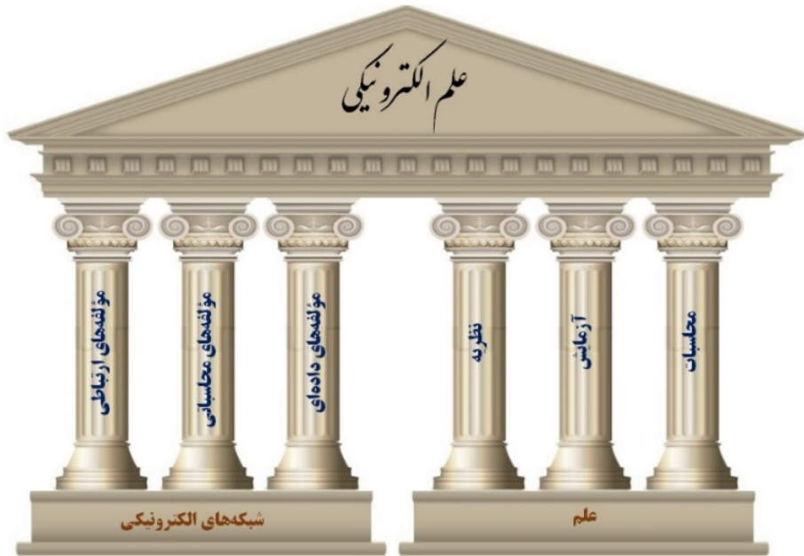
شکل ۱. علم الکترونیکی و ارکان اصلی آن

دلیل اصلی روی آوردن دانشمندان به علم الکترونیکی در سه مورد خلاصه می‌شود: انفجار داده‌های علمی، نیاز به پردازش و محاسبات پیچیده و نیاز به تعامل با دانشمندان دیگر (Cañas et al. 2006; Wouters 2006).