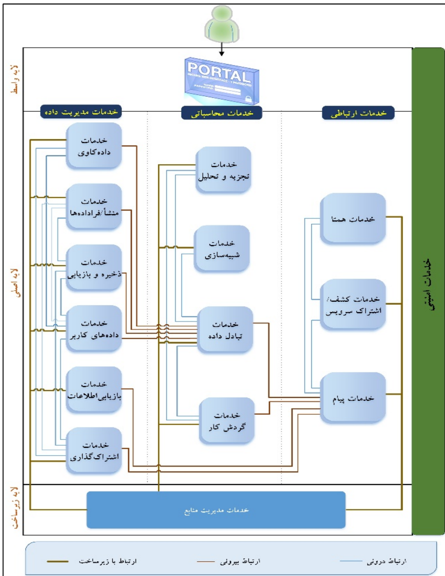
شکل ۳. نمای جامع معماری سرویس‌گرای علم الکترونیکی

در این بخش برای جمع‌بندی، نمای جامعی از معماری پیشنهادی به همراه جزئیات تشریح شده در قسمت‌های قبل، در شکل ۳ ترسیم شده است. در این شکل، ارتباط بین مؤلفه‌ها و نحوه تعامل آنها با یکدیگر به نمایش درآمده است.