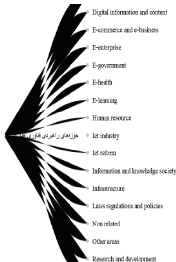
شکل ۱. حوزه‌های راهبردی فناوری اطلاعات (پروژه استخراج حوزه‌های راهبردی فناوری اطلاعات از اسناد ملی ایران و سایر کشورها)

است. در مرحله پایانی این پروژه اسناد راهبردی پیش گفته (۱۱۴ سند) و برخی اسناد مرتبط دیگر (۱۲۲۸ سند) با استفاده از روش‌های هوشمند به حوزه‌های راهبردی فناوری اطلاعات پیوست و قابل بازیابی شده است. بر اساس ساختار درختی نهایی ایجاد شده (شکل ۱)، موضوع‌های راهبردی اصلی شامل کاربردها، فضای سایبری، اطلاعات و محتوای دیجیتال، منابع انسانی، صنعت، جامعه اطلاعاتی و دانش، زیرساخت، قوانین، مقررات، و خط‌مشی‌ها، اصلاحات، تحقیق و توسعه، و ارتباطات هستند که هر کدام به زیرشاخه‌هایی تعریف شده است.