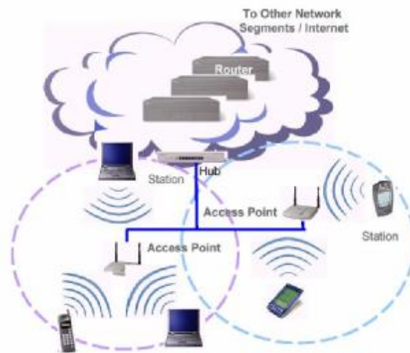
شکل 2. پیکربندی شبکه های مبتنی بر AP

ناحیه ای که توسط یک AP، تحت پوشش قرار می گیرد، سلول 1 نامیده می شود. هر ایستگاه کاری در داخل یک سلول می تواند به AP دسترسی پیدا کند. وسعت ناحیه تحت پوشش یک AP متغیر است و به طراحی و ساخت AP، محیطی که در آن کار می کند و قدرت ارسال کنندگی آن، بستگی دارد (Drew 2006) (شکل 2).