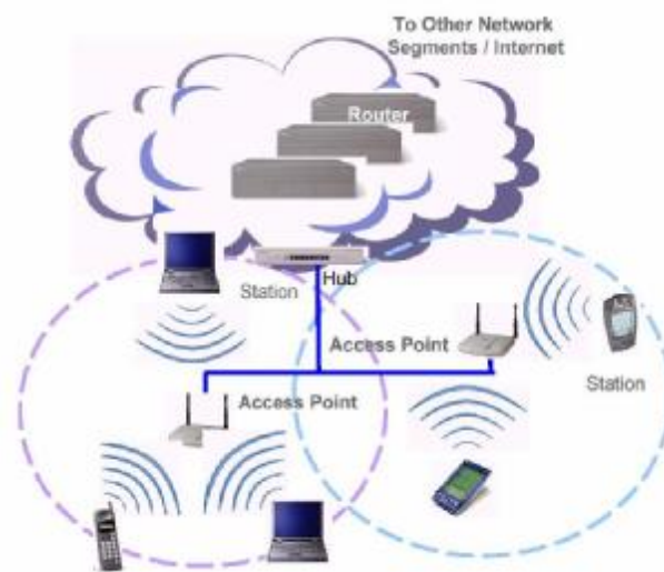
شکل 2. پیکربندی شبکه های مبتنی بر AP

ناحیه ای که توسط یک AP، تحت پوشش قرار می گیرد، سلول 1 نامیده می شود. هر ایستگاه کاری در داخل یک سلول می تواند به AP دسترسی پیدا کند. وسعت ناحیه تحت پوشش یک AP متغیر است و به طراحی و ساخت AP، محیطی که در آن کار می کند و قدرت ارسال کنندگی آن، بستگی دارد (Drew 2006) (شکل 2).