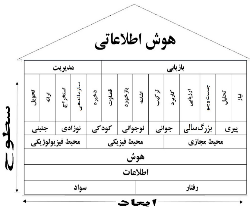
شکل ۳. چارچوب پیشنهادی پژوهش برای اندازه‌گیری هوش اطلاعاتی

در کنار هوش تلفیقی (Petrides 2021) می‌تواند باشد. این هوش به دامنه اطلاعاتی و توانایی فرد برای درک مشکل اطلاعاتی شخصی ربط دارد و می‌تواند رفتارهای اطلاعاتی را برای دستیابی به هدف‌های معینی از جمع‌آوری، سازماندهی و استفاده از اطلاعات به کار بندد، بلکه «اسپینک» به طور خاص، هوش اطلاعاتی را به هوش چندگانه «گاردنر» مرتبط می‌داند. اما به نظر می‌رسد که مؤلفه‌های هوش اطلاعاتی گسترده‌تر و جامع‌تر از اینها باشد. همچنین «اسپینک» معتقد است که بسیاری از جنبه‌های رفتار اطلاعاتی به اندازه کافی شناخته نشده است که بتوان هوش اطلاعاتی را به عنوان یک هوش انسانی کاملاً مستقل و مورد پذیرش توجیه کند. با انجام مطالعات بیشتر، ضمن درک بهتر از خصیصه‌های رفتار اطلاعاتی انسان، مدلی مناسب‌تر توسط متخصصان رفتار اطلاعاتی برای هوش اطلاعاتی می‌توان ارائه نمود. با اتخاذ دیدگاه تلفیقی و چندگانه هوش می‌توان به چارچوبی تجمیعی از هوش اطلاعاتی دست یافت. در همین راستا، شاید شکل زیر الگوی بهتری برای مباحث رفتار اطلاعاتی در رابطه با هوش اطلاعاتی باشد و دید مفیدتری را ایجاد نماید؛ اما نیاز به مطالعه بیشتری دارد.