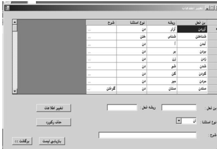
تصویر ۴: تصحیح اطلاعات افعال و چگونگی افزایش شرح

با کلیک بر روی هر یک از واژه‌ها می‌توان بن فعل و مضارع آن را تغییر داد و در قسمت شرح نیز شرحی در مورد آن فعل وارد نمود. پس از آن، می‌توان بر روی قسمت تغییر اطلاعات و یا حذف رکورد کلیک نمود که در این صورت صفحه‌ای مانند تصویر ۵ ظاهر می‌شود و سؤال "تغییرات ذخیره شود" را نشان می‌دهد.