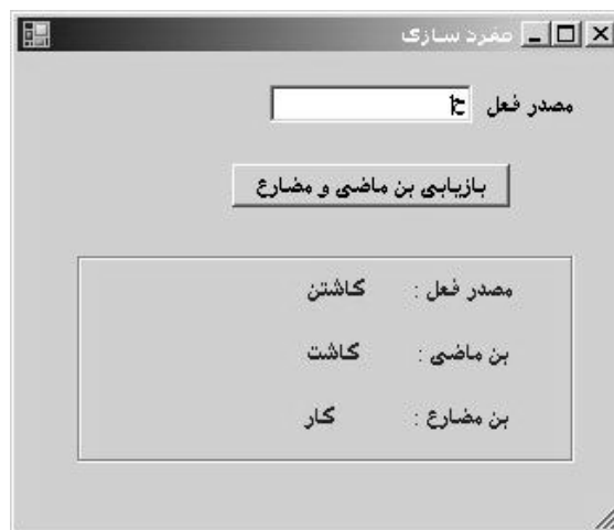
تصویر ۸. صفحه ی اصلی کار با نرم افزار

- آزمون نظام در یک محیط واقعی انجام گرفت و به خوبی پاسخ داد. از آنجایی که الگوریتم خاصی طراحی شد، بنابراین این الگوریتم با سایر الگوریتم‌ها تفاوت فاحش دارد. این نظام قادر است پاسخ‌های سریعی را در کمترین زمان با حجم بالا فراهم آورد (تصویر ۸).