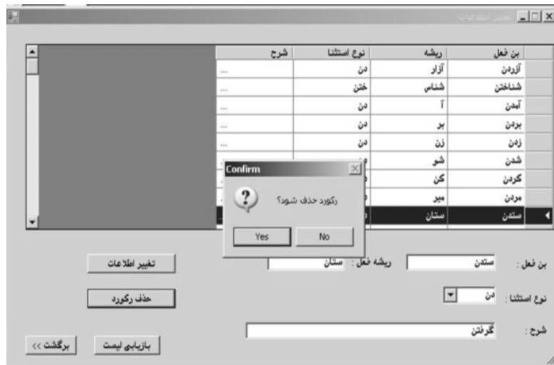
تصویر ۶. تایید نهایی حذف رکورد

در صورت کلیک بر روی "Yes"، سؤال "رکورد حذف شود" ظاهر می شود (تصویر ۶).