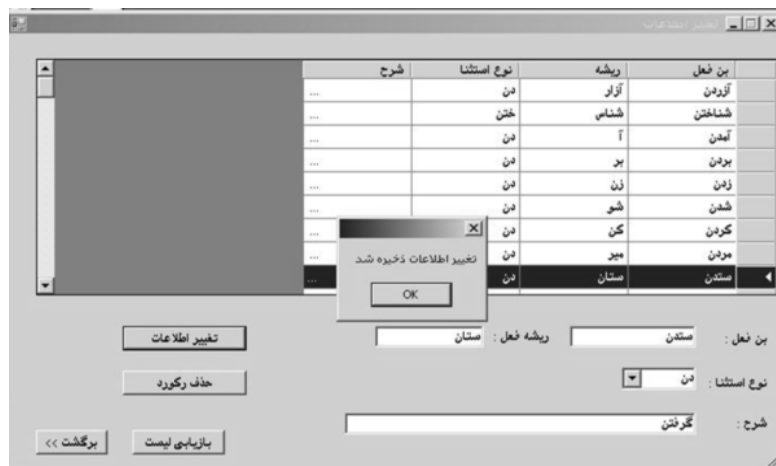
تصویر ۷. اعلام انجام موفقیت آمیز اصلاحات از سوی برنامه

با کلیک مجدد بر روی "Yes" رکورد حذف می شود و در صورت کلیک بر روی "حذف رکورد" سؤال "رکورد حذف شود" را نشان می دهد (تصویر ۷) با تعیین پاسخ، هر یک صفحه دوباره به حالت اولیه خود باز می گردد.