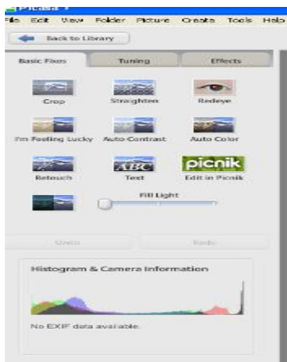
شکل ۴. نمونه ای از بُردار یک عکس در نرم افزار پیکاسا که در گوگل آلبوم مورد استفاده قرار می گیرد.

در این بازیابی نام فایل که آپلود می شود چندان مهم نیست، اما مرورگر وبی که از طریق آن جست و جو انجام می شود مهم است، چرا که جست و جوهای مشابه در مرورگرهای مختلف ممکن است نتایج متفاوتی را ارائه کند. این قابلیت برای افرادی که به دنبال تصاویر مشابه از افراد خاصی هستند چندان مناسب نیست، اما افرادی که به دنبال اطلاعات و تصاویر مشابه از مناظر، مکان های مهم و تاریخی، نقشه ها و به طور کلی هر آنچه که نیازی به قابلیت تشخیص چهره نداشته باشد هستند، این قابلیت به خوبی می تواند به آنها کمک کند (McGee 2011).