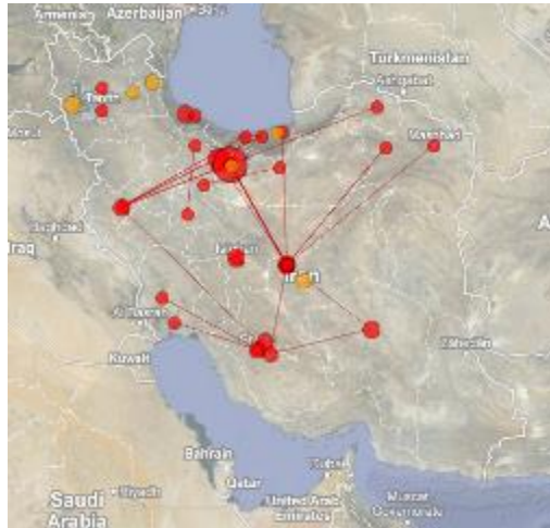
تصویر ۷. توزیع جغرافیایی انتشارات علمی در حوزه موضوعی انرژی آبی در ایران