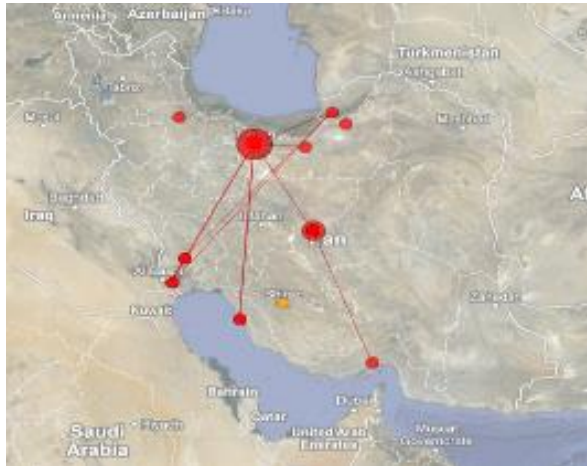
تصویر ۲. توزیع جغرافیایی انتشارات علمی در حوزه موضوعی آلودگی دریایی در ایران

به عبارت دیگر، نوعی همگونی در توزیع تحقیقات علمی در این حوزه با قابلیت‌های جغرافیایی موجود در مناطق جنوبی کشور وجود دارد، اما این مهم در سطح کشور نشان‌دهنده نبود رابطه مستقیم میان توزیع انتشارات علمی و قابلیت‌های جغرافیایی در حوزه موضوعی آلودگی دریایی است.