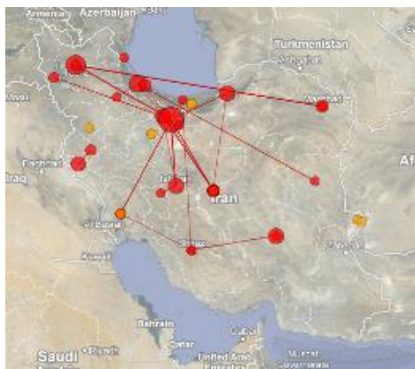
تصویر ۵. توزیع جغرافیایی انتشارات علمی در حوزه موضوعی جای در ایران

جهت انجام تحقیقات علمی در حوزه موضوعی جای بیشتر در مناطق شمالی کشور است و این مهم نشان‌دهنده وجود رابطه مستقیم میان بهره‌گیری از قابلیت‌های جغرافیایی موجود در شمال کشور و تولید انتشارات علمی در این منطقه می‌باشد. اما در حالت کلی، به دلیل حجم بسیار زیاد تولیدات علمی بدون توجه به منطقه جغرافیای خاص، رابطه مستقیمی میان قابلیت‌های جغرافیایی و توزیع تولیدات علمی در این حوزه مشاهده نمی‌شود.