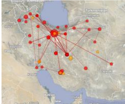
تصویر ۸. توزیع جغرافیایی انتشارات علمی در حوزه موضوعی انرژی بادی در ایران