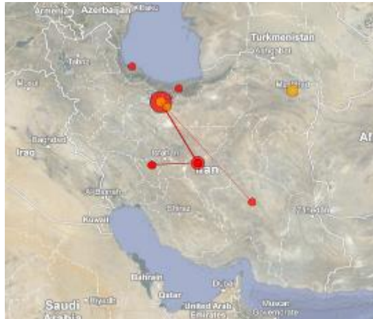
تصویر ۴. توزیع جغرافیایی انتشارات علمی در حوزه موضوعی بیماری تب شالیزار در ایران

تحلیل محتوایی مقالات نشان می‌دهد که از ۱۹ مقاله مورد بررسی ۸ مقاله، یعنی حدود ۴۷/۰۵ درصد به جغرافیای مورد بررسی تحقیق خود اشاره نکرده‌اند، با این وجود، ۹ مقاله یعنی ۵۲/۹۴ درصد به منطقه جغرافیایی خاص برای انجام پژوهش خود اشاره داشته‌اند. در این میان، مناطق جغرافیایی این انتشارات علمی به دو دسته مناطق شمالی کشور و سایر مناطق تقسیم شده‌اند که از میان آن تنها ۳ مقاله به بررسی این بیماری در نواحی شمالی و باقی به بررسی آن در سایر نقاط کشور پرداخته‌اند. این مطلب نشان‌دهنده توزیع ناهمگون تولیدات علمی در مقایسه با خود بیماری است، زیرا در مناطقی که بیماری تب شالیزار به عنوان مشکل بومی شناخته شده، تولیدات علمی به درستی تمرکز نیافته‌اند.