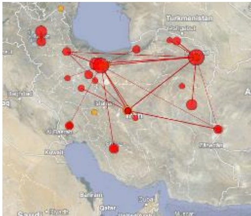
تصویر ۶. توزیع جغرافیایی انتشارات علمی در حوزه موضوعی زعفران در ایران

خراسان رضوی بیش از سایر مناطق در کشور است. این مهم نشان‌دهنده وجود رابطه مستقیم میان بهره‌گیری از قابلیت‌های جغرافیایی موجود در نیمه شرقی کشور و تولید انتشارات علمی در این منطقه است. به عبارت دیگر، نوعی همگونی در توزیع تحقیقات علمی در این حوزه موضوعی با توزیع قابلیت‌های جغرافیایی موجود در این منطقه برای انجام تحقیقات مربوطه وجود دارد.