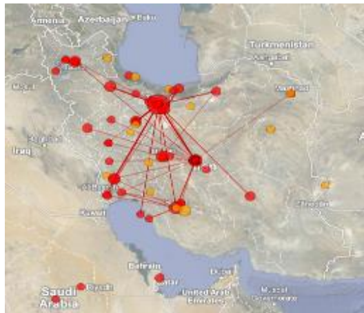
تصویر ۹. توزیع جغرافیایی انتشارات علمی در حوزه موضوعی چاه نفت در ایران

امکانات و قابلیت‌ها در استان‌های تهران و خوزستان، تولید بیشتر انتشارات علمی در این استان‌ها نیز دور از ذهن نخواهد بود.