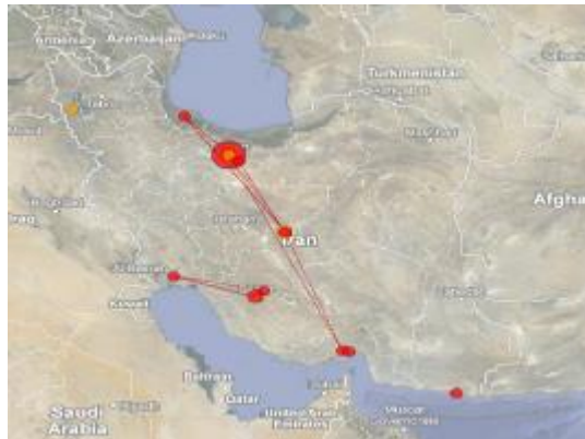
تصویر ۱. توزیع جغرافیایی انتشارات علمی در حوزه موضوعی اقیانوس‌شناسی در ایران

جغرافیایی مورد مطالعه در تحقیق نشده است. به عبارت دیگر، از ۲۵ مقاله مورد بررسی، ۱۶ مقاله یعنی حدود ۶۶/۶۶ درصد به جغرافیای مورد بررسی تحقیق خود اشاره کرده‌اند و تنها ۸ مقاله یعنی ۳۳/۳۳ درصد از آنها مناطق شمالی و جنوبی کشور را به عنوان جغرافیای مورد بررسی تحقیق خود برگزیده‌اند. لازم به ذکر است که از این تعداد، ۵ مقاله (۶۲/۵ درصد) سواحل جنوبی کشور را به عنوان جغرافیای هدف برای انجام تحقیق خود برگزیده و تنها ۳ مقاله (۳۷/۵ درصد) به سواحل شمالی کشور در تحقیقات خود در این حوزه پرداخته‌اند. پس می‌توان نتیجه گرفت که تمرکز تولیدات علمی در مناطق جنوبی کشور بیشتر است و در نتیجه، تلاش در جهت انجام تحقیقات علمی در حوزه موضوعی اقیانوس‌شناسی در مناطق جنوبی بیش از مناطق شمالی کشور می‌باشد. این مهم نشان‌دهنده وجود رابطه مستقیم میان بهره‌گیری از قابلیت‌های جغرافیایی موجود در جنوب کشور و تولید انتشارات علمی در این منطقه است. به عبارت دیگر، نوعی همگونی در توزیع تحقیقات علمی در این حوزه موضوعی با توزیع قابلیت‌های جغرافیایی موجود در مناطق جنوبی کشور برای انجام تحقیقات مربوطه وجود دارد، اما این مهم در سطح کشور نشان‌دهنده نبود رابطه مستقیم میان توزیع انتشارات علمی و قابلیت‌های جغرافیایی حاکم در حوزه موضوعی اقیانوس‌شناسی است.