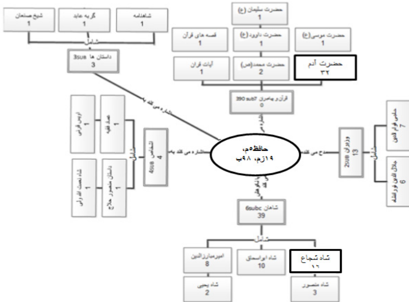
شکل ۱. شبکه معنایی ضمنی تلمیحات در شعر حافظ

در ۸ بیت نیز به طور پنهان امیر مبارزالدین را «نکوهش می کند»؛ از جمله: دوش بر یاد حریفان به خرابات شدم / خم می دیدم و خون در دل و پا در گل بود به طور ضمنی و پنهان امیر مبارزالدین را «نکوهش می کند» و اندوه خود را از آمدن او و رفتن شاه ابواسحاق بیان می کند. در ابیات زیر نیز دو وزیر را «مدح می کند»: نخست، جلال الدین تورانشاه را آشکارا و دوم خواجه قوام الدین را به طور پنهان: تورانشه خجسته که در من یزید فضل / شد منت مواهب او طوق گردنم بزمگاهی دل نشان چون قصر فردوس برین / گلشنی پیرامنش چون روضه دارالسلام