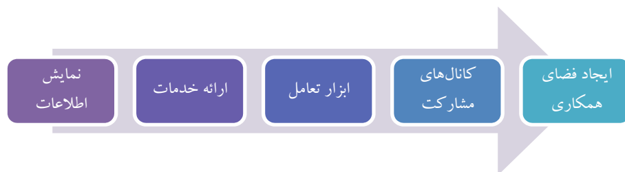
شکل ۱. روند توسعه خدمات دولتی (Sandoval-Almazan & Gil-Garcia 2012)

دانشمندان و محققان بر این باورند که مهم‌ترین فعل و انفعالات و معاملات میان شهروندان و دولت در سطح تراکنش‌های محلی اتفاق می‌افتد. این روابط می‌تواند بسیار نزدیک‌تر و به‌صورت مکرر با استفاده از فناوری‌های اطلاعات و ارتباطات (فناوا) تحقق یابد. به‌عنوان مثال، رسانه‌های اجتماعی و دیگر ابزارهای وب ۲ می‌توانند کانال‌های جدید الکترونیکی را برای این تعامل از طریق گنجاندن آن‌ها در پورتال دولت (محلی) ارائه کنند. شکل زیر روند توسعه خدمات دولتی را در فضای سیستم‌های عامل جدید مثلاً بر روی تلفن‌های همراه هوشمند نمایش می‌دهد: