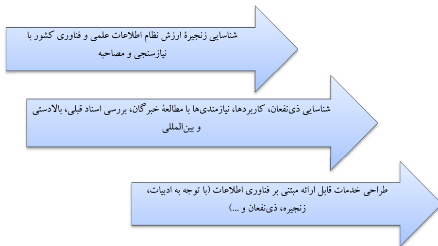
شکل ۲. فرایند انجام تحقیق

با توجه به رویکرد آمیخته در این مطالعه از چند روش کیفی استفاده خواهد شد. با توجه به گام‌های ذکر شده در شکل زیر، رویکرد تحقیق در این مقاله نظریه زمینه‌ای است. این رویکرد از جمله روش‌هایی برای پژوهشگر است که قصد شناخت منظم دیدگاه‌ها و معانی «روش نظریه زمینه‌ای» افراد در یک موقعیت خاص را دارند. این رویکرد پژوهشگر با به کارگیری روش‌های گوناگون جمع‌آوری اطلاعات و مطالعات رفت و برگشت میان نظریه (تحلیل داده‌ها) و واقعیت (گردآوری داده‌ها)، شناخت نظری دقیقی از پدیده مورد مطالعه برای تحقیق فراهم می‌کند. در زیر مراحل انجام این تحقیق آمده است.