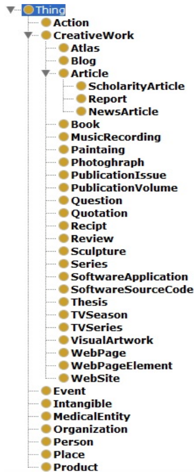
شکل ۱. نمایشی از سطوح نوع‌ها در فرآیند تولید داده‌های ساختارمند بر روی وب

نوع «CreativeWork» دارای بیشترین زیرنوع است که در شکل ۱ نیز مشخص است و حتی برخی از زیرنوع‌های آن نظیر «Article» دارای زیرنوع‌های دیگری است. هر نوع در سلسله‌مراتب، دارای صفاتی است و به‌واسطه ساختار سلسله‌مراتب گونه، از نوع پدر (مافوق) خود ارث می‌برد. به‌عبارت دیگر، هر کدام از صفات یک نوع بر تمام زیرنوع‌های خود نیز کاربرد دارد. به‌طور مثال، صفاتی که توسط نوع‌های دیگر از صفات اصلی «thing»، به‌عنوان بالاترین سطح ارث می‌برند، عبارت‌اند از: