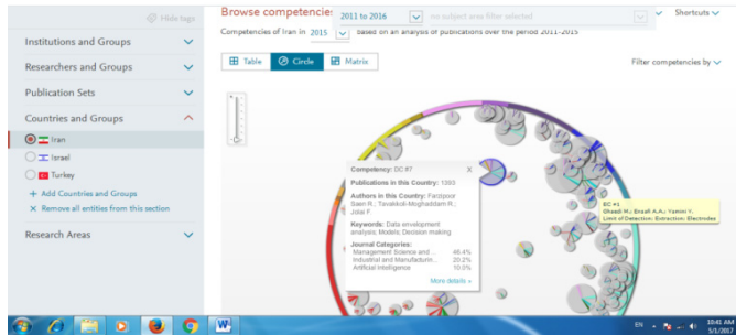
شکل ۲. نمایش دایره‌ای شایستگی‌های پژوهشی ایران در سال ۲۰۱۵

شایستگی پژوهشی، در قالب‌های جدول، نقشه، یا ماتریس برای یک کشور یا مؤسسه ارائه می‌شود. شکل ۲، نمایش دایره‌ای شایستگی‌های پژوهشی ایران را نشان می‌دهد.