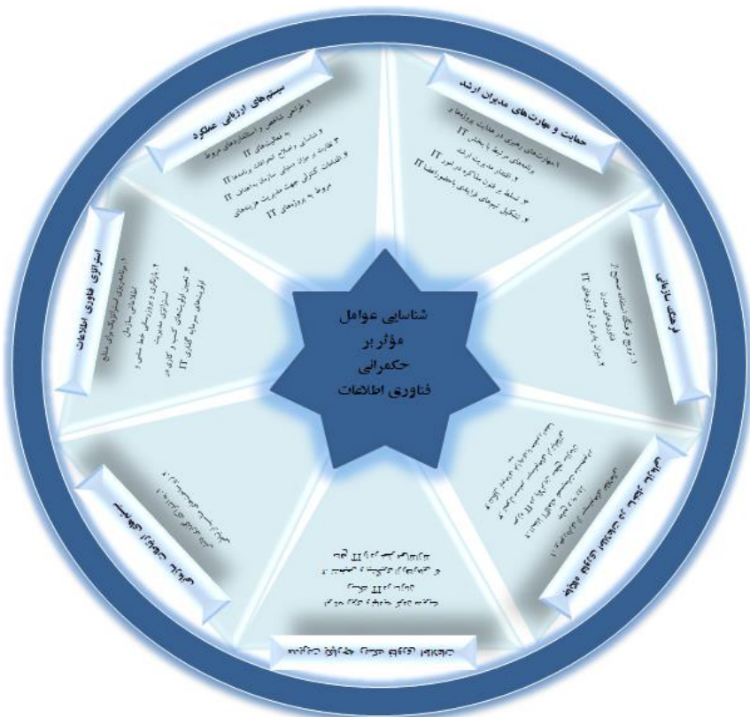
شکل ۳. دسته‌بندی زیرعوامل مربوط به هر عامل با توجه به نتایج فن دلفی

پس از اجرای فرایند دلفی فازی، عوامل و زیرعوامل تأییدشده مطابق شکل ۳، ترسیم می‌گردد.