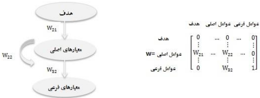
شکل ۲. ساختار شبکه‌ای و سوپرماتریس اولیه

لازم به ذکر است که ماتریس حاصل از تکنیک «دیمتل» (ماتریس ارتباطات داخلی)، در واقع تشکیل‌دهنده بخشی از سوپرماتریس فوق است. به عبارت دیگر، تکنیک «دیمتل» به‌طور مستقل عمل نمی‌کند، بلکه به‌عنوان زیرسیستمی از سیستم بزرگ‌تری چون «ای‌پی‌ان» ۱ است. در واقع، در این مرحله «دیمتل» و «ای‌پی‌ان» فازی ترکیب می‌شوند تا با استفاده از روش فرایند تحلیل شبکه‌ای، عوامل بر اساس میزان اهمیت رتبه‌بندی شوند. در ساختار ماتریسی، هدف در سطح اول شبکه و عوامل اصلی در سطح دوم قرار می‌گیرند که عوامل اصلی دارای وابستگی درونی هستند (ماتریس حاصل از تکنیک «دیمتل»). در ساختار مربوطه، عوامل فرعی در سطح سوم قرار می‌گیرند. در سوپرماتریس W ، W_{21} وزن نسبی عوامل اصلی با توجه به گره هدف، W_{22} وزن داخلی بین عوامل اصلی و W_{32} وزن عوامل فرعی نسبت به عوامل اصلی متناظرشان است. ماتریس T که خروجی روش «دیمتل» فازی است، پس از نرمال‌سازی به‌عنوان ماتریس W_{22} ، در نظر گرفته می‌شود. برای محاسبه W_{21} و W_{23} از مقایسات زوجی استفاده می‌شود. این فرایند از طریق مقایسات دوجه‌دو با پرسش این سؤال آغاز می‌شود: تا چه میزان این معیار در مقایسه با سایر معیارها با توجه به علایق و ترجیحات، اهمیت/ تأثیر بیشتری دارد؟ ارزش اهمیت نسبی را می‌توان با استفاده از مقیاس ۱ تا ۹ با در نظر گرفتن اهمیت تعریف نمود (Saaty 1996). متغیرهای زبانی و اعداد فازی مورد استفاده برای مقایسات زوجی در جدول ۵، درج شده است.