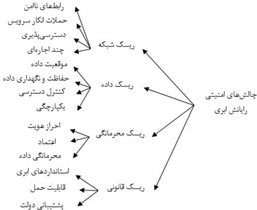
شکل ۱. دسته‌بندی ریسک‌های امنیتی رایانش ابری

است، روابط سیاسی دولت‌ها باید از شرایط مطلوبی برخوردار باشد (Avram et al. 2014). پس از استخراج ریسک‌های امنیتی رایانش ابری از طریق مطالعه پژوهش‌های پیشین و با نظر خبرگان حوزه پژوهش، این عوامل دسته‌بندی شدند (شکل ۱).