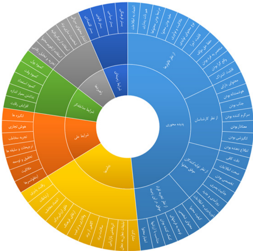
شکل ۳. مدل دایره‌ای عوامل شناسایی شده حاصل از نظریه داده‌بنیاد

همچنین در شکل ۴، مدل مفهومی خروجی بخش کیفی قابل ملاحظه است: