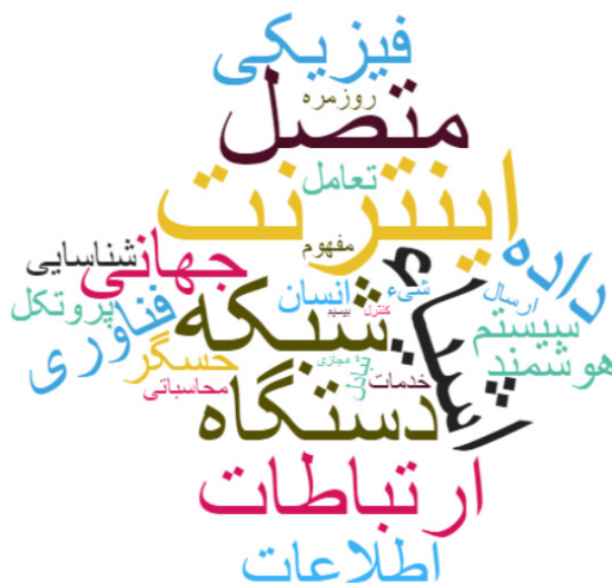
شکل ۱. ابر کلمه اینترنت ایشیا منطبق بر تعاریف ارائه شده

در پاسخ به پرسش دوم، همان‌طور که در نمودار ۲، مشاهده می‌شود، در بیشتر تعاریف بر جمع آوری / تبادل / سنجش / پردازش و اشتراک گذاری داده‌ها و اطلاعات (۵۸ درصد)، یکپارچگی (۹ درصد)، قابلیت شناسایی (۱۳ درصد)، قابلیت آدرس دهی (۷ درصد)، و حداقل دخالت یا بدون دخالت انسان (۱۳ درصد) اشاره شده است. در ادامه، شکل ۱، ابر کلمات تعاریف اینترنت ایشیا را نشان می‌دهد.