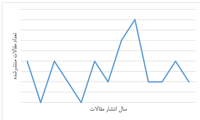
نمودار ۲. روند انتشار کل مقالات شهر هوشمند و کودک و نوجوان در پایگاه‌های اطلاعاتی مورد مطالعه